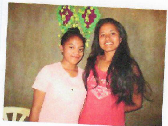
Patenkind mit Familie/Vertrauensperson